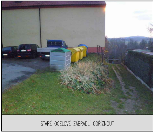
STARÉ OCELOVÉ ZÁBRADÍ ODŘÍZNOUT