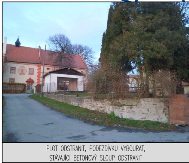
PLOT ODSTRANIT, PODEZDVKU VYBOURAT, STÁVAJÍCÍ BETONOVÝ SLOUP ODSTRANIT