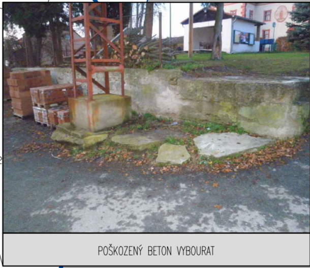
POŠKOZENÝ BETON VYBOURAT