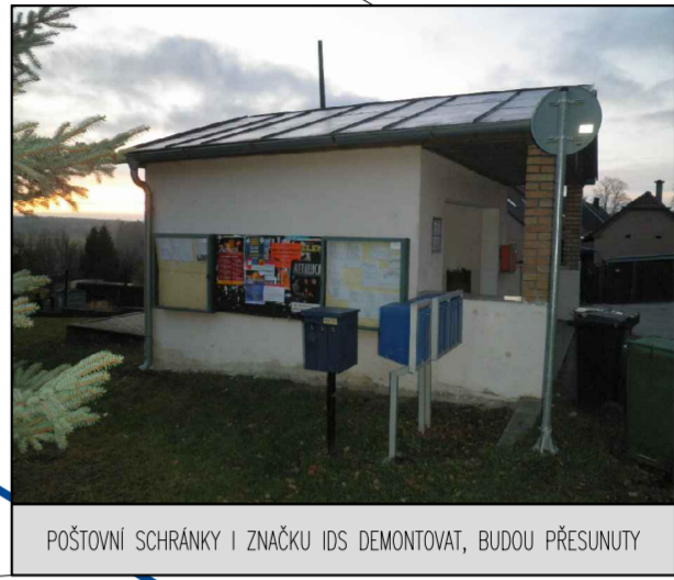
POŠTOVNÍ SCHRÁNKA I ZNAČKA IDS DEMONTOVAT, BUDOU PŘESUNUTY