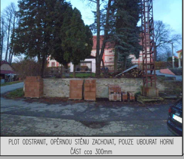
PLOT ODSTRANIT, OPĚRNOU STĚNU ZACHOVAT, POUZE UBOURAT HORNÍ ČÁST cca 300mm