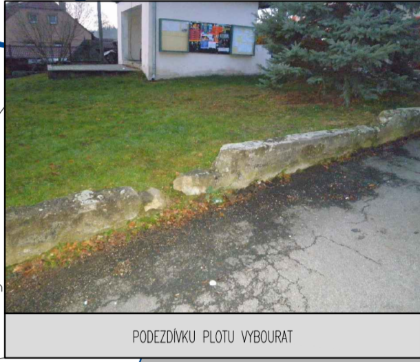
PODEZDVKU PLOTU VYBOURAT